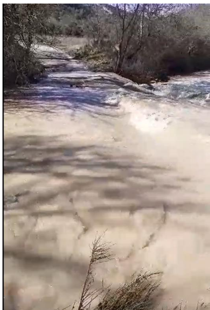
Le 1er avril 2024, après de fortes pluies, la Nesque est en crue. Elle a de nouveau emporté les aménagements provisoires réalisés le 12 mars

2024 par la Mairie de Méthamis et la Mairie de Blauvac au chemin de la Nesque