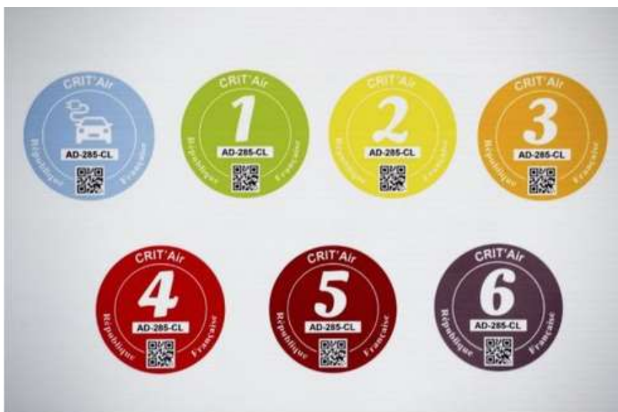
vignettes Crit'air

La vignette Crit'Air est d'ores et déjà obligatoire lors des épisodes de pollution de l'air dans plusieurs agglomérations telle que Paris, Marseille, Nice, Lyon ou Strasbourg.