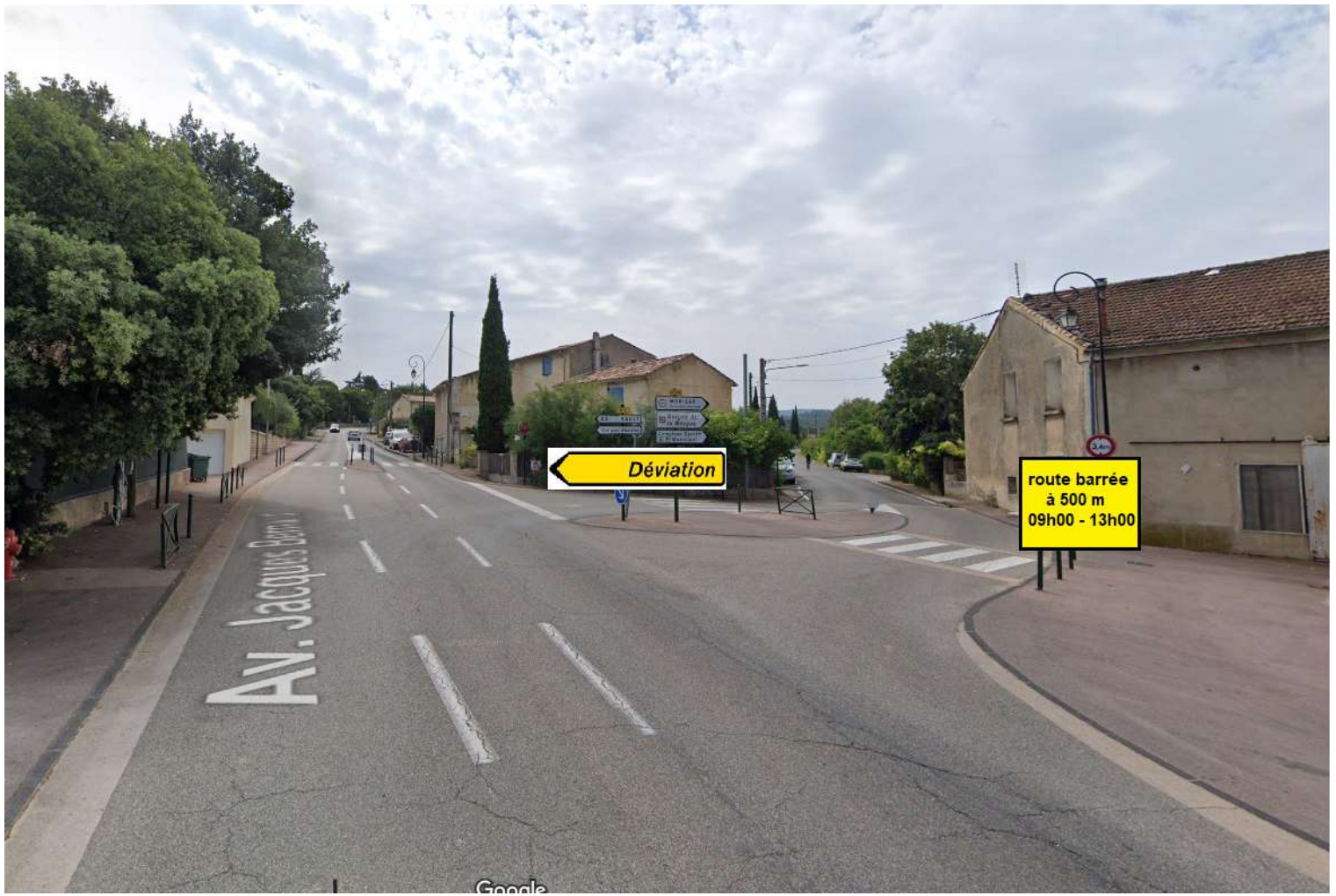
3 D942 - Route des Gorges de la Nesque – Intersection D942/D1